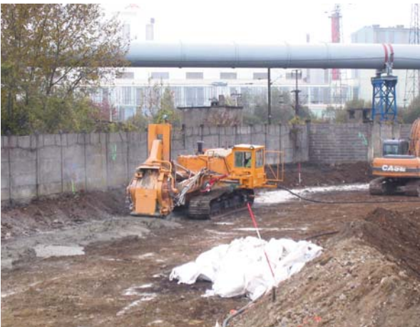
Confinement latéral superficiel