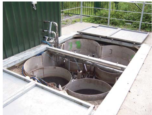
BPR : Traitement d'eau in-situ