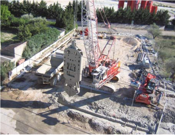
Confinement latéral profond