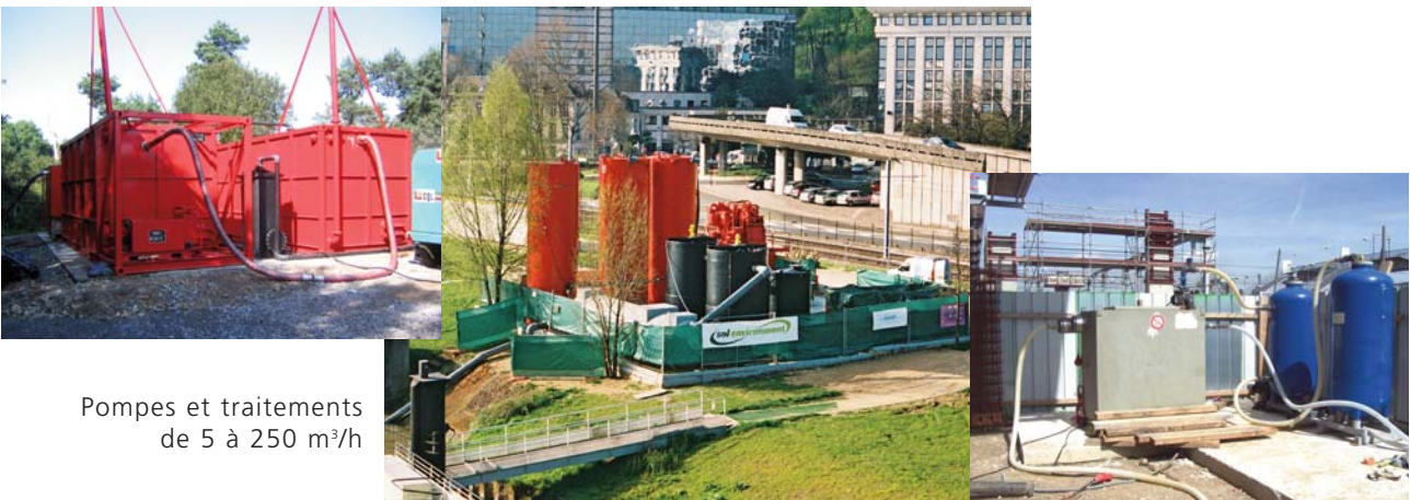
Pompes et traitements de 5 à 250 m 3 /h